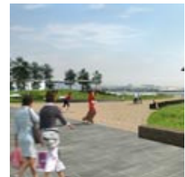
תוכנית הפיתוח הדמיונית: מייזליץ כסיף אדריכלים

התוכנית המקורית, שקודמה על ידי מינהל מקרקעי ישראל ועיריית עכו, ביקשה לייבש 150 דונם של שטחי ים ולקדם בנייה נרחבת של כ-2,000 יחידות דיור בסמוך לקו החוף. התוכנית הנוכחית, שגובשה כעת מטעם העירייה והחברה הכלכלית לפיתוח עכו, על ידי משרד האדריכלים מייזליץ כסיף - מוותרת כמעט לחלוטין על ייבוש הים ומסתפקת בייבוש רצועה קטנה של כמה עשרות מטרים בלבד באזור חוף התמרים.